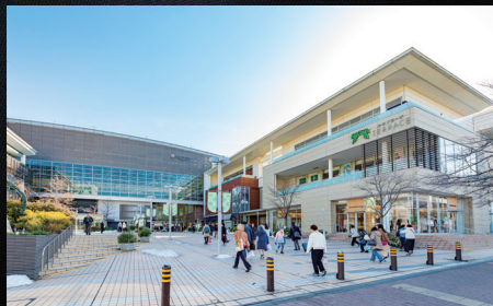
たまプラーザ駅(2024年2月撮影)