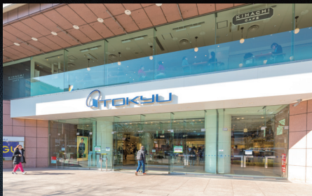
東急百貨店(2024年2月撮影)