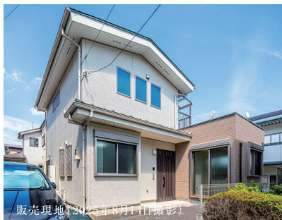
販売現地（2025年8月1日撮影）