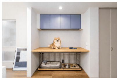
ワンちゃん専用スペース

※掲載の写真は実際の室内を撮影したものを基に、AIによりペットおよびペット用品を合成し、暮らしのイメージを表現したものです。